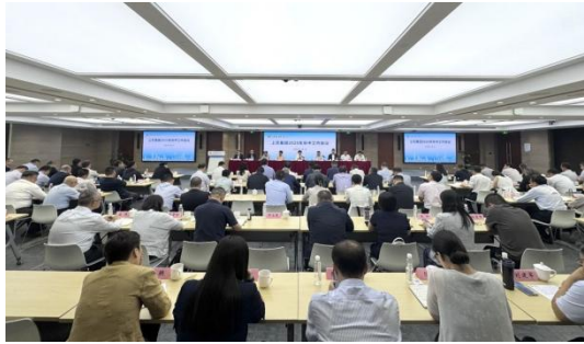
图3 上实集团年中工作会议

8月4日，上实集团召开2025年年中工作会议。会议深入学习贯彻落实中央政治局会议精神、习近平总书记考察上海重要讲话精神和市委、市政府决策部署，总结上半年成绩，部署下半年及今后一个时期重点工作，确保实现全年工作任务、高质量完成“十四五”战略目标。会议指出，面对复杂多变的内外部环境，集团上下一心、咬定目标，聚焦两大产业主赛道，优化完善结构布局，加快科创数智建设，提升核心竞争力，上半年营业收入1519.3亿元、利润总额83.3亿元，实现“时间过半、任务过半”。会议强调，下半年要继续发挥“干字当头、奋力一跳”的精气神，稳中有进提升经营效益，进中向好巩固发展势头，奋力完成好全年和“十四五”规划目标任务。